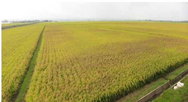
いもち病発生圃場