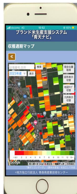
図1 マップの表示画面（収穫適期マップ）