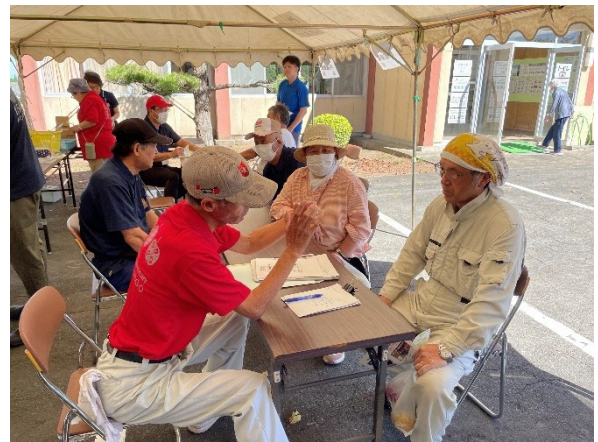
果樹栽培無料相談所