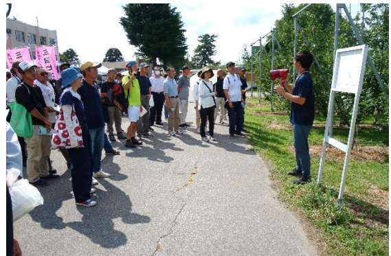
試験圃場見学ツアー