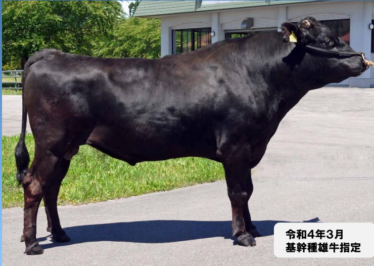
令和4年3月 基幹種雄牛指定