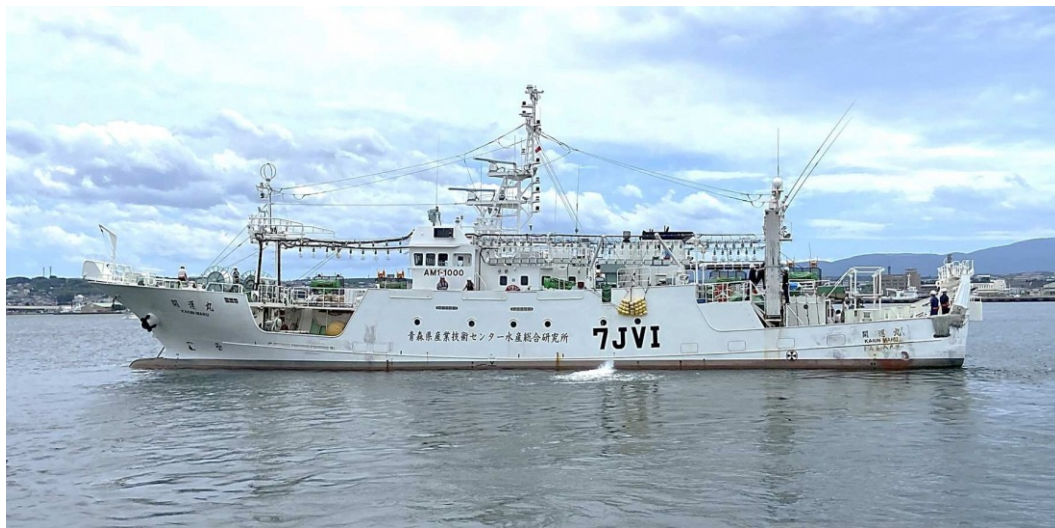
漁業試験船「開運丸」