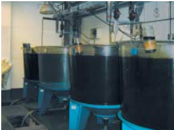
1トン水槽4基によるバッチ培養