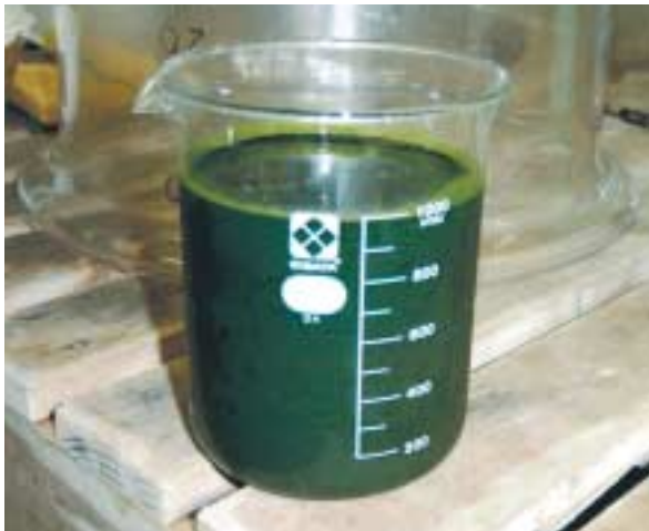
濃縮冷凍の淡水クロレラ（まるで青汁）