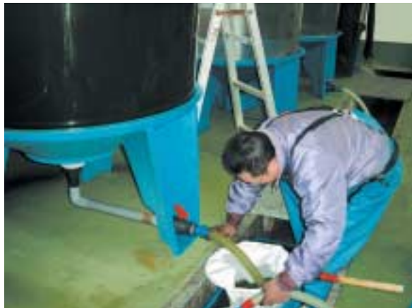
フムシの収穫（抜き取り）風景