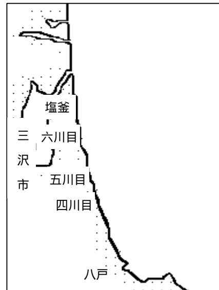
図 1 調査点